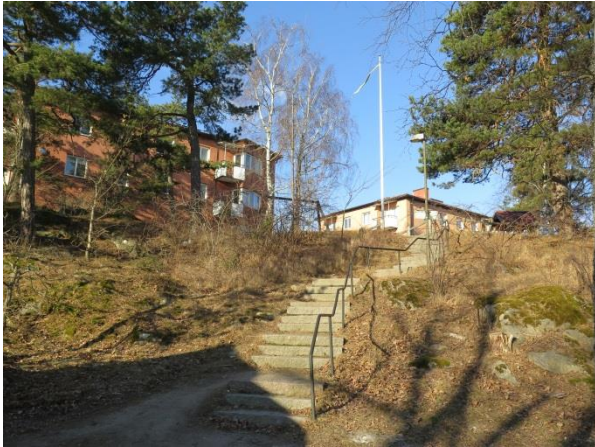
Figur 20. Den västra delen av bostadsområdet ligger på en höjd och nås från söder via en granittrappa.