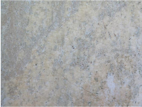
Figur 28. Marmor, dörrumfattning entré.