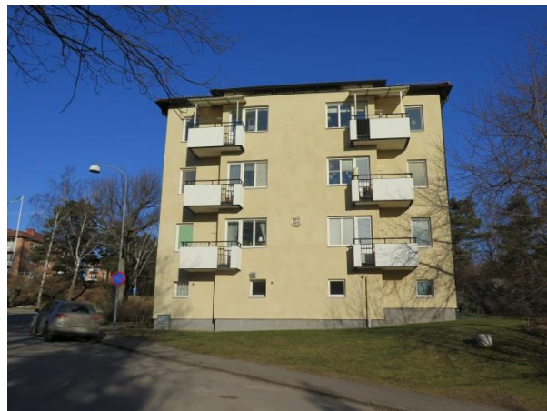
Figur 25. Gavel.