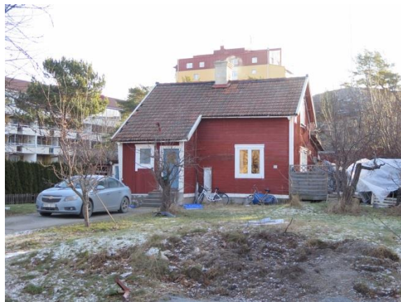
Figur 11. Hus i östra delen av utredningsområdet, uppfört före 1906.