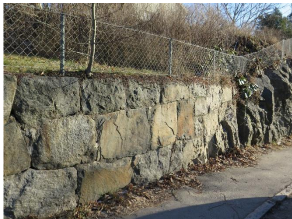
Figur 15. Stödmur av tuktad natursten i korsningen Skolgatan/Höjdgatan.