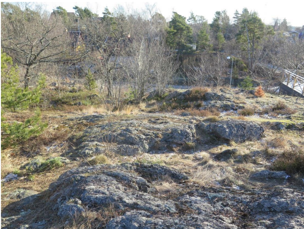
Figur 4. Vy mot sydöst från planområdets topp.