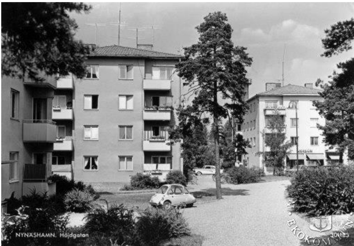
Figur 9. Vy mot Höjdgatan 11 och 12. Troligtvis 1950-tal.