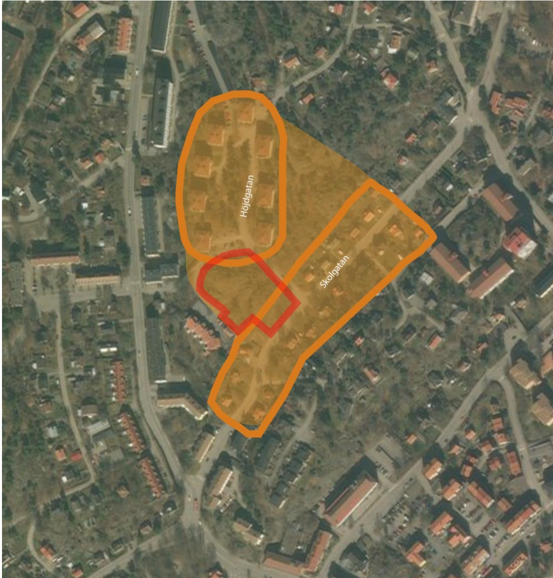
Figur 2. Röd markering: Planområdet. Orange markering: Utredningsområdet, med de två delområdena markerade i en starkare nyans.

Utredningsområdet har avgränsats till de kulturmiljöer som ligger i direkt närhet till planområdet. Dessa utgörs av två utbyggnadsperioder; egnahemsvillor från tidigt 1900-tal längs med Skolgatan i sydost och punkthus från 1940-talet längs med Höjdgatan i norr.