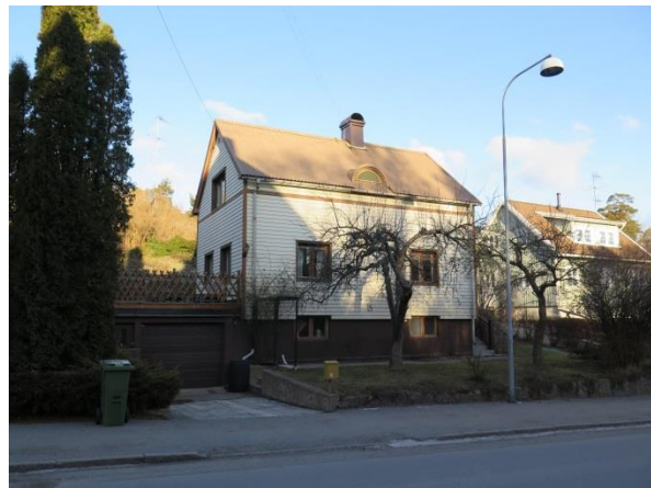
Figur 13. Villa med bevarat lunettfönster.