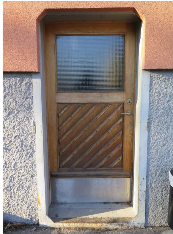
Figur 31. Dörr med omfattning med avfasade hörn.