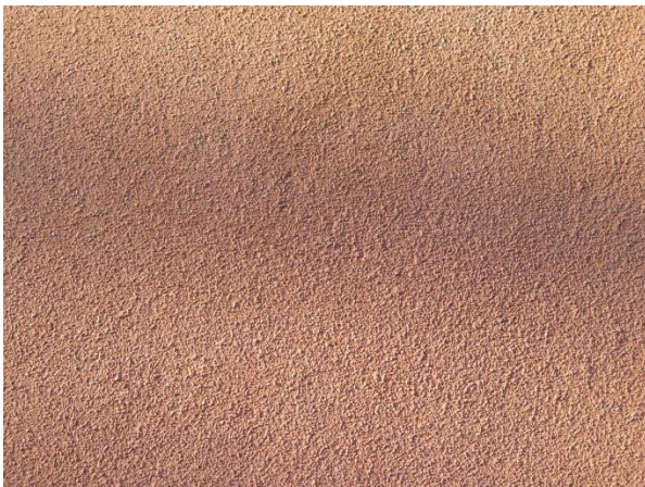
Figur 26. Fasadkulör i områdets västra del.