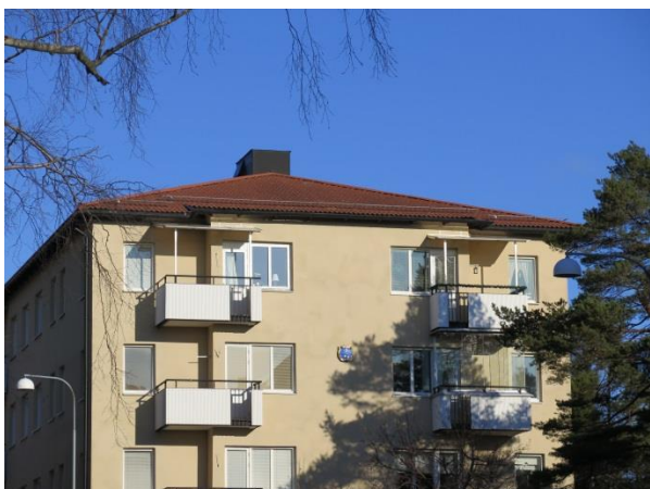
Figur 32. Flacka, valmade tak.