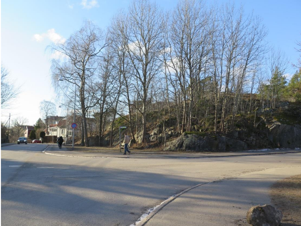
Figur 3. Planområdet från nordost.

Planområdet utgörs av en bergig naturmarkstomt. I planen för Höjdgatan från 1940-talet är området markerat som Park eller planterad allmän plats . Platsen verkar dock aldrig ha genomgått någon omgestaltning utan består än idag av en bergsknalle med vild, inhemsk växtlighet. Möjligen var platsen aldrig tänkt att omgestaltas utan lämnades orörd i likhet med det bergiga området mellan Höjd- och Skolgatan.