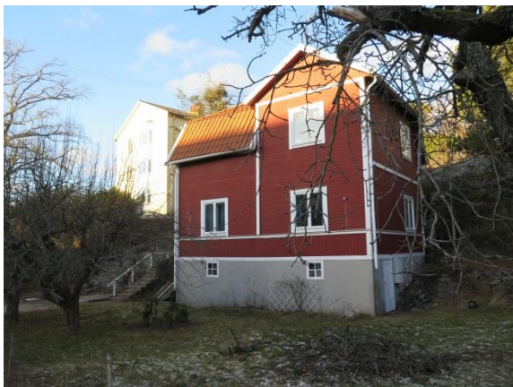
Figur 10. Villa i områdets västra del uppförd före 1906. Delvis välbevarad karaktär med ursprunglig liggande faspanel och vita lister, hög sockel och mansardtak.

1930-talshusen ligger en bit indragna på flacka tomter omgivna av låga staket medan de äldre villorna ligger på mer kuperade och större tomter med mycket grönska och stora träd. Nordväst om Skolgatan breder ett kuperat naturområde ut sig och fler av villorna har branta bergväggar och vild natur som fond.