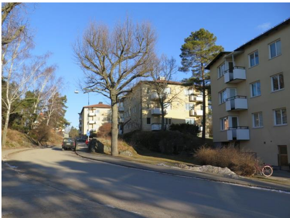
Figur 16. Svängt gatunät och fristående punkthus omgiven av sparad samt tuktad naturmark.

Sedan området byggdes har växtlighet och grönytor behållit sin karaktär relativt oförvanskad. Framför Höjdgatan 5 ligger numera en parkering som troligtvis inte hör till områdets ursprungliga planering.