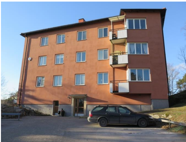
Figur 24. Entréfasad.

Fasaderna är tilläggsisolerade och balkonger, fönster samt dörrar har bytts ut eller renoverats. Ambitionen har dock varit att efterlikna ursprungliga eller tidstypiska material och detaljer, varför bebyggelsens helhetskaraktär till stor del är bevarad.