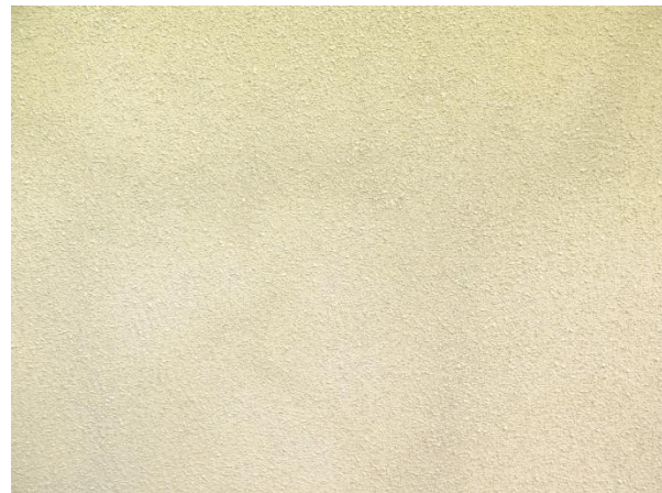
Figur 27. Fasadkulör i områdets östra del.