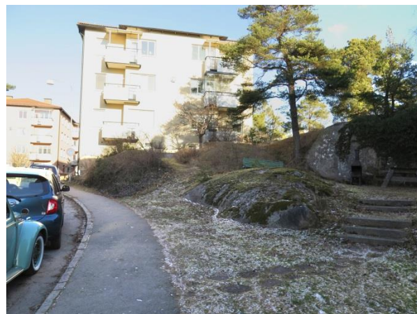
Figur 23. På grönytorna mellan husen finns bänkar, grillplats, lekplats m.m.