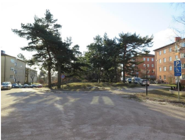
Figur 18. Grönytan sedd från norr.