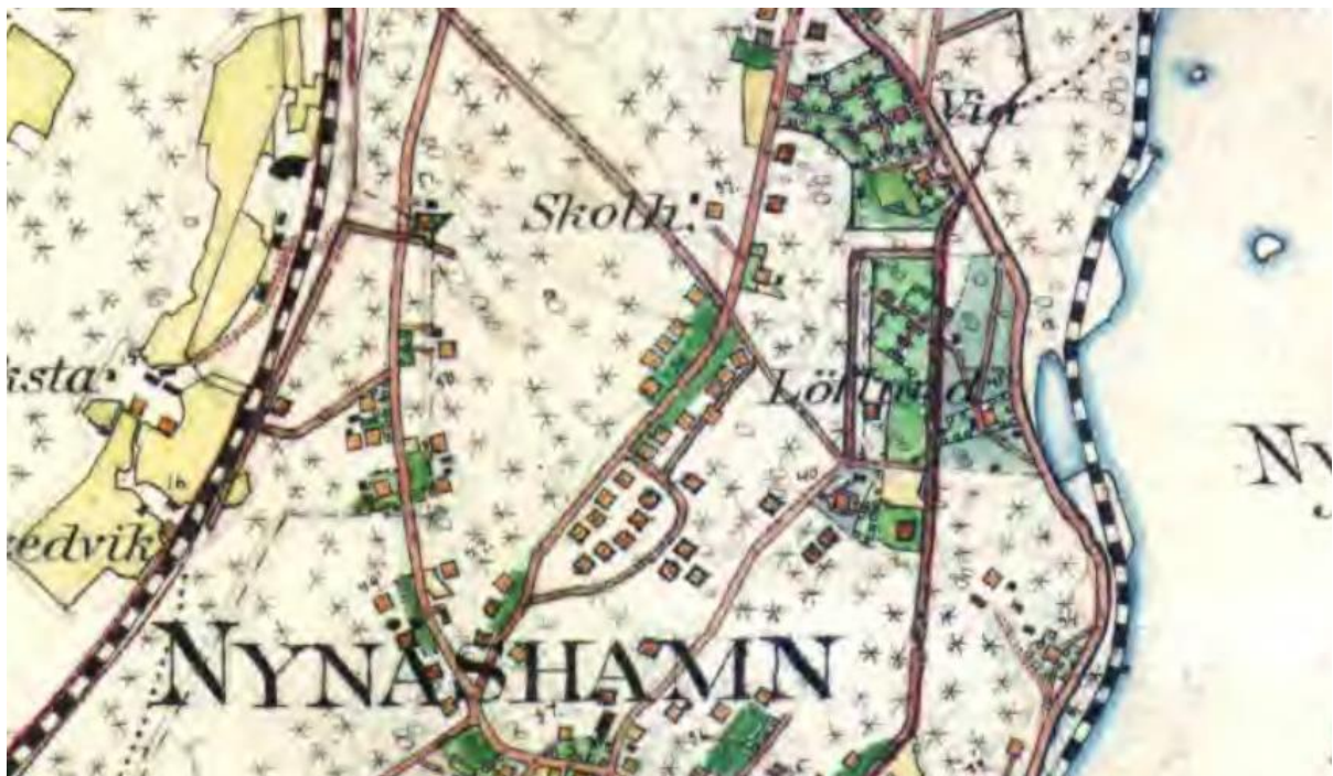
Figur 5. Häradseconomiska kartan från 1906. Nynäshamn var vid den här tiden nyanlagt och hade vuxit fram under åren som gått sedan järnvägen stod färdig 1901. Den aktuella sträckningen av Skolgatan syns i mitten av kartan och var vid den här tiden bebyggd med 12 egnahemsvillor.

Skolgatan hör till de äldsta gatorna i staden. 1906 när Häradseconomiska kartan för Nynäshamn ritades fanns inom utredningsområdet fyra villor på Skolgatans västra sida samt åtta villor på Skolgatans östra sida. Stora delar av marken på Skolgatans östra sida bestod av kuperad skogsmark.