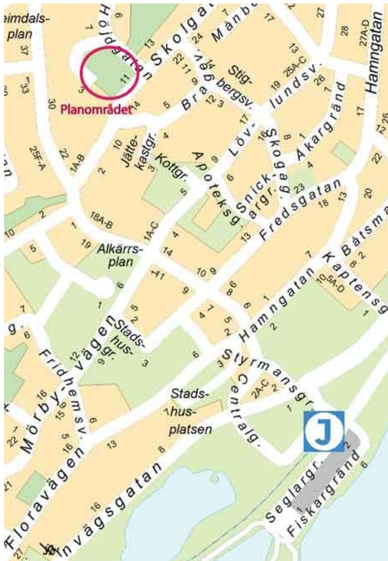
Figur 1. Detaljplaneområdets orientering i staden.

Planeringsunderlaget har till syfte att karaktärisera områdets kulturhistoriska värden och hur dessa tar sig uttryck rent fysiskt i miljön. Detta illustreras genom historiskt och nutida kart- och bildmaterial.