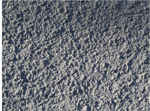
Figur 29. Spritputs, sockel.