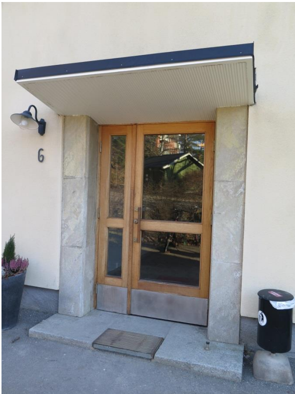
Figur 30. Entré med marmoromfattning, skärmtak och dörr av ljus trä.