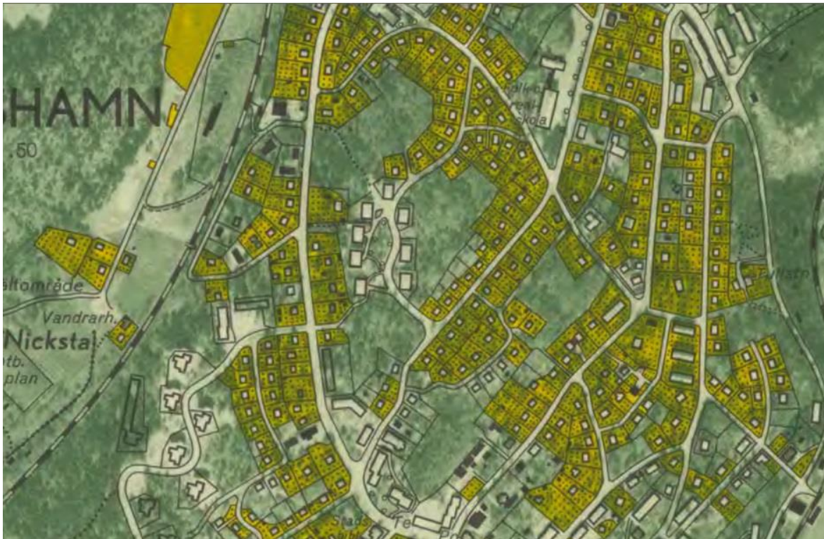
Figur 8. Ekonomiska kartan från 1951. Höjdgatan har anlagts och längs med den har 3-4 våningar höga punkthus uppförts. Längs med Skolgatan har nu fler egnahemsvillor byggts, främst under 1930-talet.