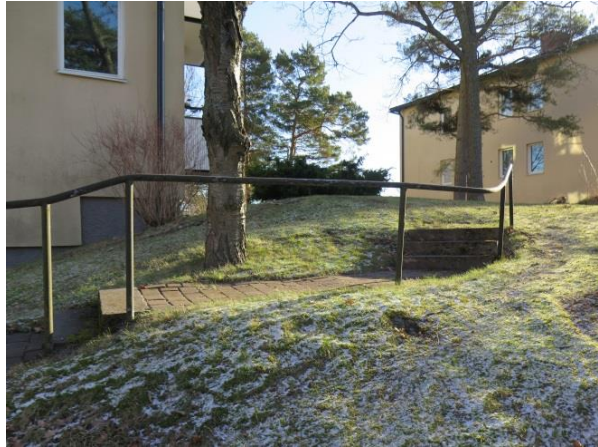
Figur 21 . Enkla stålräcken kantar trapporna i området.