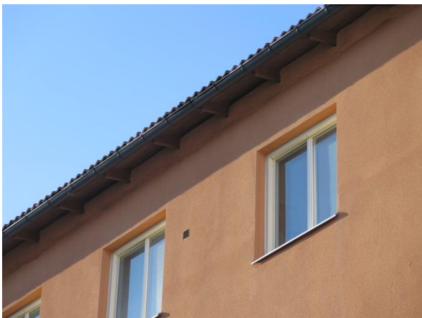
Figur 33. Takkonsoler i takfoten.