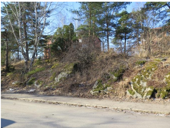
Figur 22. Berg i dagen är ett viktigt inslag i miljön.