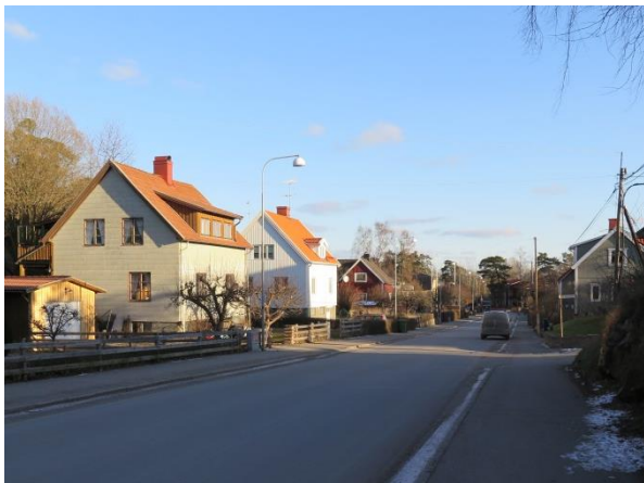
Figur 12. Nordöstra delen av Skolgatan sedd från sydväst. Villorna har likartad byggnadsvolym och branta sadeltak.