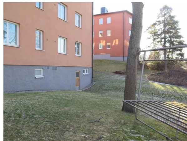
Figur 19. Kuperade gräsytor omger några av husen.