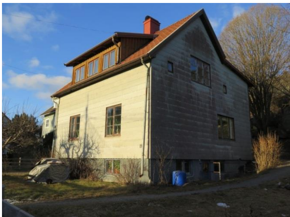
Figur 14. Villa med bevarade originalfönster.