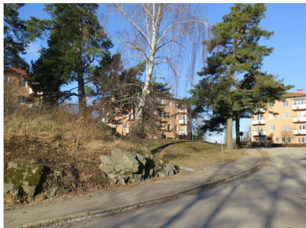
Figur 17. Bostadshusen är utplacerade kring en stor grönyta med bland annat stora inhemska träd, berg i dagen och en sentida lekplats.