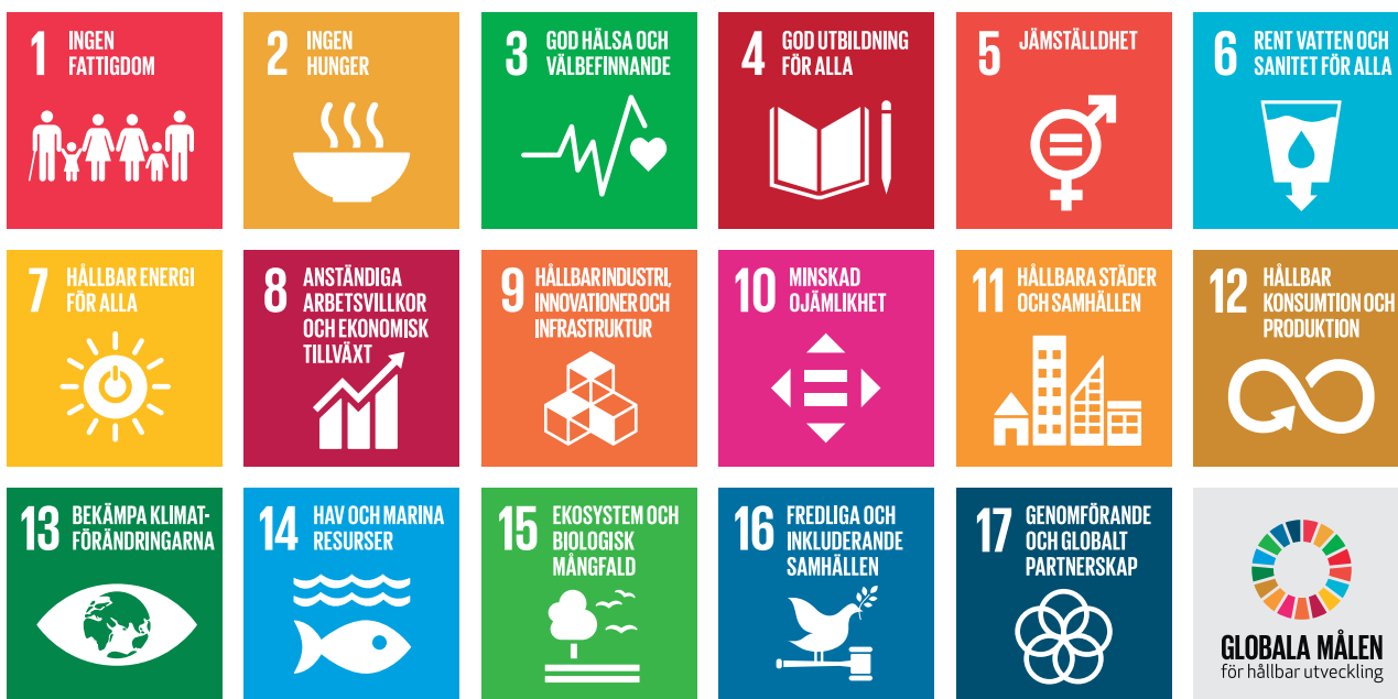
Figur 2. FN:s 17 globala hållbarhetsmål

Ett ekonomiskt hållbart byggande innebär bland annat att skapa förutsättningar för att bostäder kan byggas till rimliga kostnader och att samtidigt hushålla med resurserna mark, vatten, energi och råvaror. Det innebär också att sträva mot en cirkulär ekonomi med resurseffektiva och giftfria kretslopp.