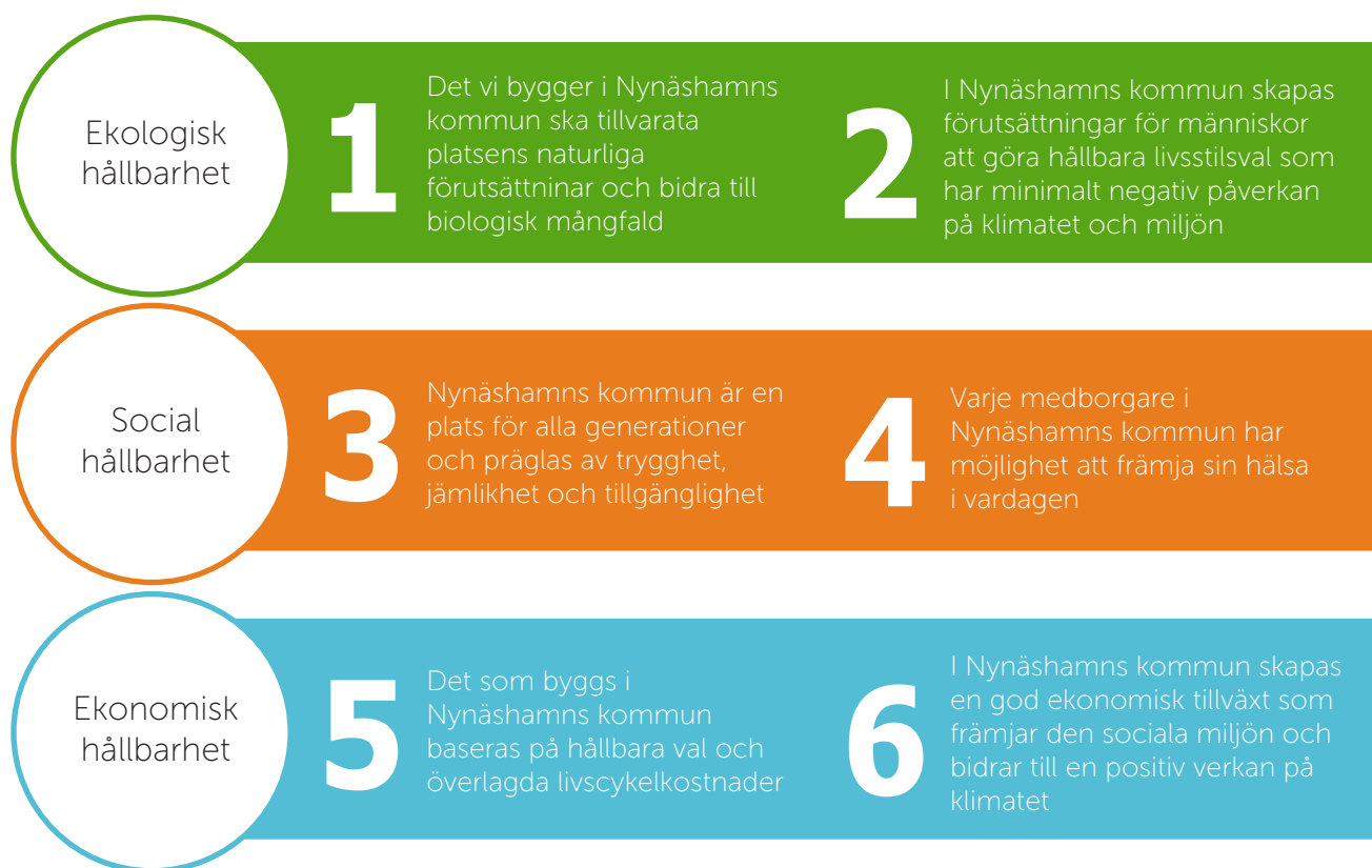
Figur 1. Nynäshamns kommuns sex riktlinjer för hållbart byggande

I varje projekt som riktlinjerna tillämpas i ska respektive riktlinje uppnå en av följande tre betygsnivåer: Godkänd , Väl godkänd eller Mycket väl godkänd . Vilken nivå som uppnås är beroende av vilka hållbarhetsaktiviteter som genomförs inom ramarna för det aktuella projektet.