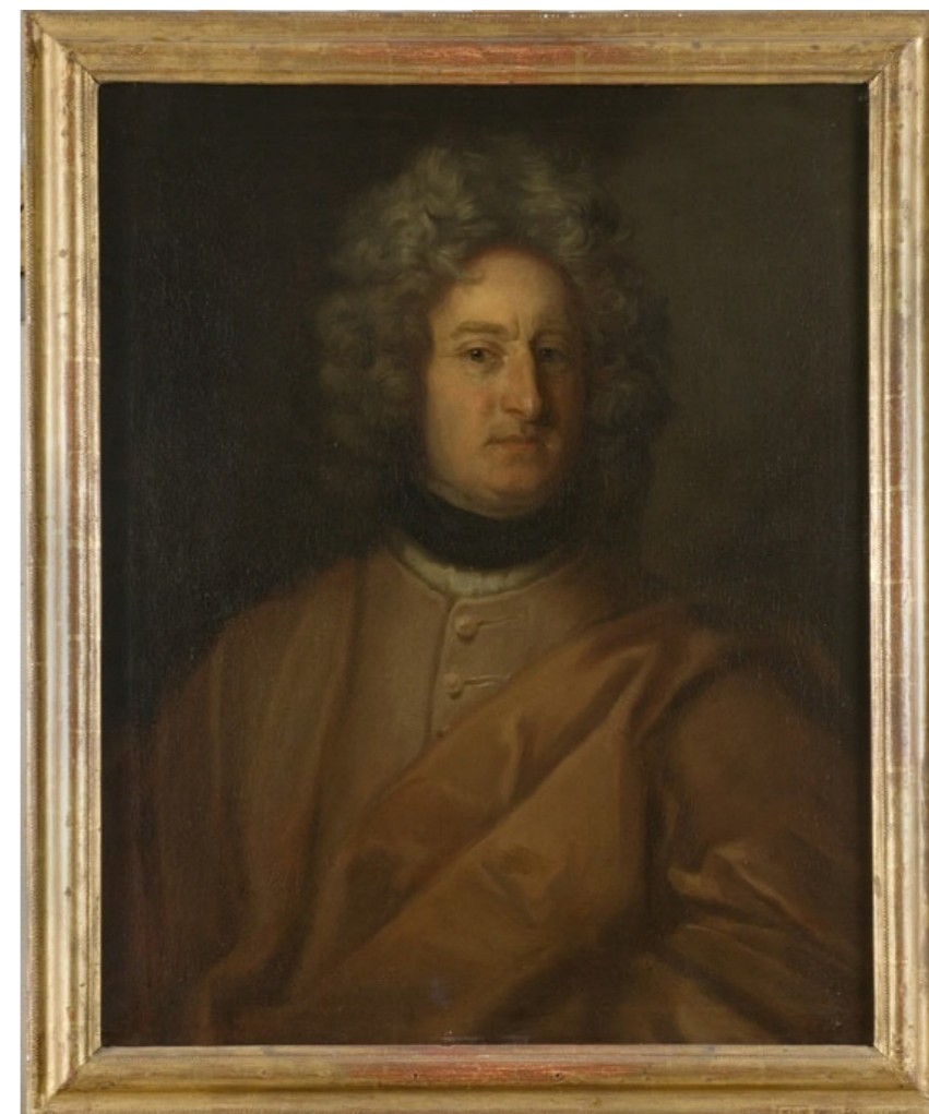
Polhem porträtterad av David von Krafft ca 1700.