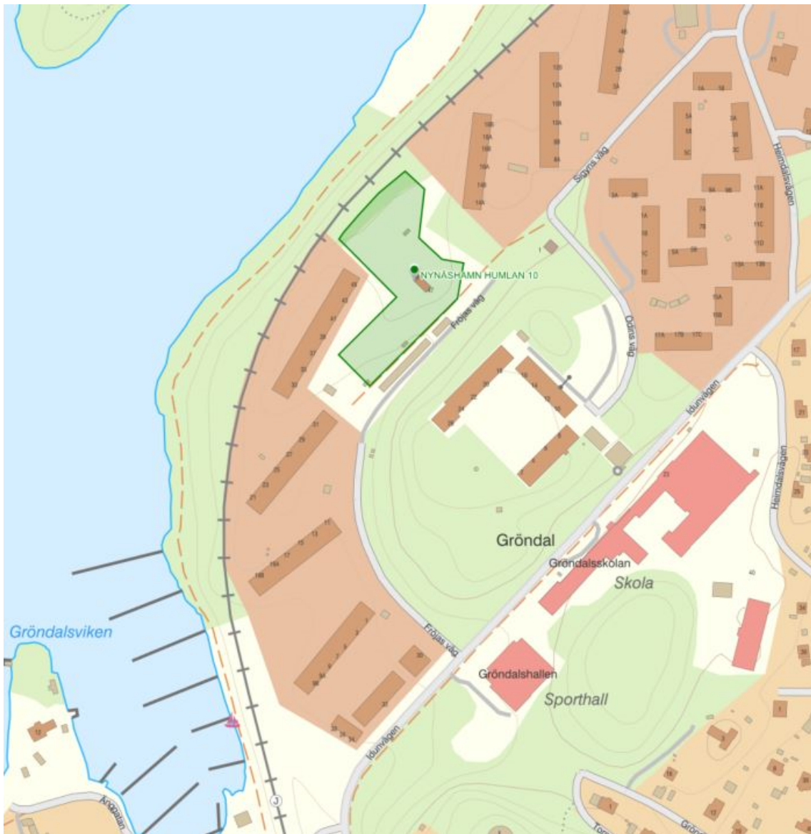
Illustration: Förslag till utredningsområde för SÄBO och bostadsbebyggelse

Det pågår sedan 2022 ett arbete inom ramen för Samhällsbyggnadsnämnden med att ta fram ett planprogram för Gröndalsområdet. I arbetet med planprogrammet har ett flertal översiktliga utredningar avseende planeringsförutsättningarna i området gjorts, såsom naturvärdesinventering, geoteknisk och bergtekniska förutsättningar, trafik samt dagvatten- och skyfallsutredning. Det finns därför redan underlag framtaget som kan användas i prövning av förutsättningarna för etablering av ett SÄBO och även ytterligare bostadsbebyggelse på den aktuella fastigheten. I det fortsatta planarbetet behöver framför allt kompletterande utredningar inom trafik (inklusive angöring), mark, buller, geoteknik, vibrationer, dagvatten och skyddsrum genomföras. Därutöver behöver en lösning för angöring för bil utredas inom ramen för det fortsatta planarbetet. Detaljplanen behöver vara färdig under första kvartalet 2025.