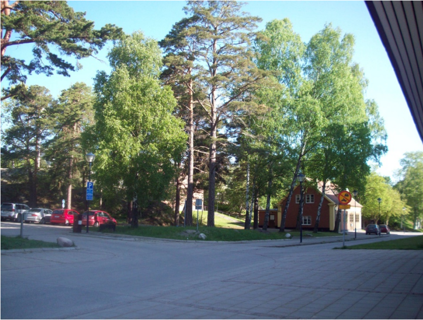
Exempel på de stora träd som bör bevaras.