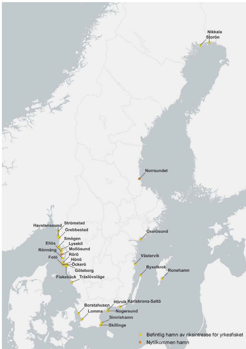
Figur 1. Rumslig fördelning av hamnar som uppfyller föreslagna kriterier för riksintresseanspråk.

En stor del av kommunens kustvattenområde är också utpekad som riksintresse för yrkesfisket. För förtydligande omfattar HaV:s översyn och aktualisering av riksintressen för yrkesfisket endast fiskehamnar och inte vattenområden.