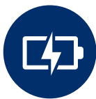
Klimat & energi

Hållbarhetsprogrammets sex målområden är: