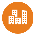
Samhällsplanering & resursanvändning