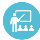
Utbildning & arbetsmarknad