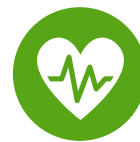
Folkhälsa & trygghet