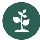
Ekosystemtjänster & biologisk mångfald