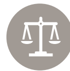
Mänskliga rättigheter & jämställdhet