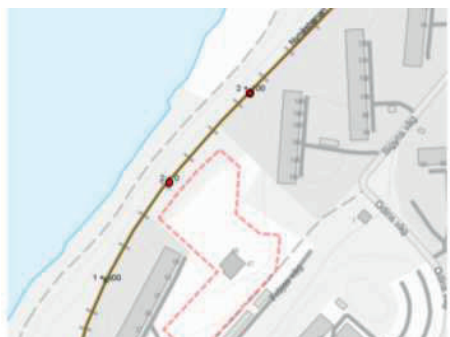
Figur 1. Röda punkter illustrerar km 2+000 – 2+100.

Trafikverket noterar att stabilitetsberäkningarna inte tagit hänsyn till ett scenario vid händelse av översvämning. Järnvägsbanken består av sand vilket utgör en risk i ett översvämningsscenario. Sand mättad med vatten kan bete sig som en vätska vid ett 100-årsregn och riskerar att äventyra järnvägens stabilitet. Trafikverket delar därmed inte kommunens bedömning om att att ytterligare behov av utredningar inom ramen för planprocessen inte kommer krävas. Trafikverket ser behov av att den geotekniska utredningen kompletteras med beräkning av järnvägsbankens stabilitet vid ett 100-årsregn med hänsyn till flödespåverkan från den planerade dagvattenhanteringen. Beräkningarna ska inkludera Nynäsbanan mellan järnvägens mätpunkter km 2+000 – 2+100.