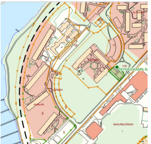
Nynäshamn 2:90, Nynäshamnsbostäder

Fastighetsägaren Amasten har redan ett positivt planbesked beviljat för Humlan 8 men velat avvakta vidare utveckling i området.