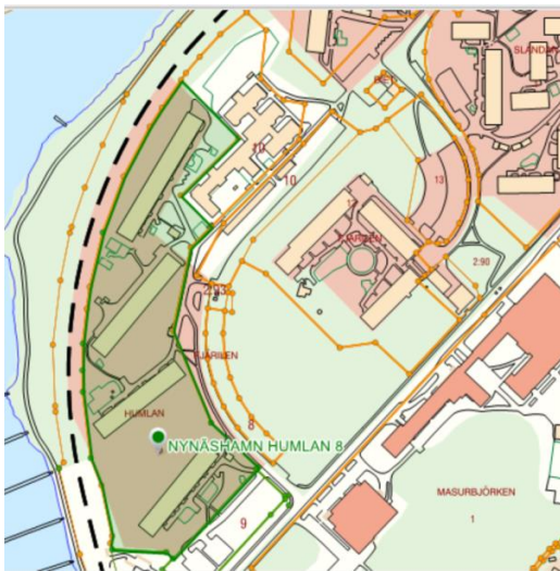
Humlan 8, Amasten Nynäshamn AB