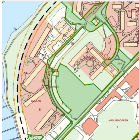
Del av Nynäshamn 2:1, Nynäshamns kommun