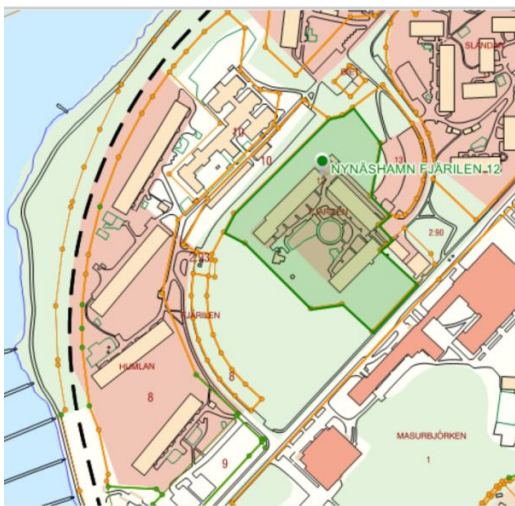
Fjärilen 12, HSB BRF Fjärilen nr 2