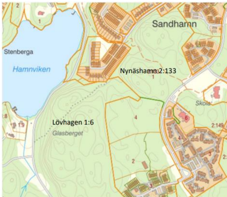
Karta med fastigheterna Nynäshamn 2:133 och del av Lövhagen 1:6.